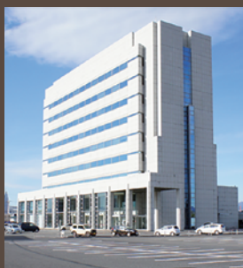
群馬県公社総合ビル 多目的ホール 群馬県前橋市大渡町1-10-7